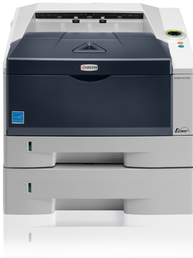
Abb. mit Optionen

Der SW-Drucker ECOSYS P2135d von KYOCERA Document Solutions ist speziell dafür ausgelegt, umfassende Druckvolumen zuverlässig und leise zu meistern. Zum geräuscharmen Betrieb kommt sein kompaktes Design, mit dem er in jede Büro-Umgebung passt. Er druckt bis zu 35 Seiten pro Minute, hat eine Papierkapazität von bis zu 800 Blatt und verfügt standardmäßig über eine Duplex-Einheit für beidseitiges und damit noch wirtschaftlicheres Drucken. Der ECOSYS P2135d ist bestens dafür gerüstet, große Druckaufgaben souverän und ohne Ausfallzeiten zu bewältigen.